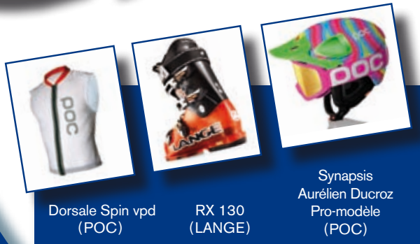
Dorsale Spin vpd (POC)